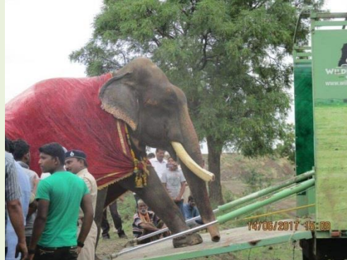
上圖：Gajraj 被鍊乞討受虐 51 年