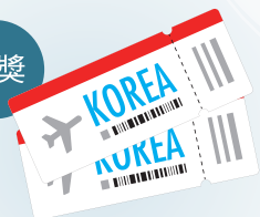
雙人首爾來回機票x1