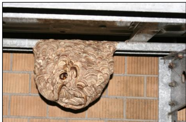
圖 3 分離式冷氣之室外機下的黃腰 虎頭蜂蜂巢