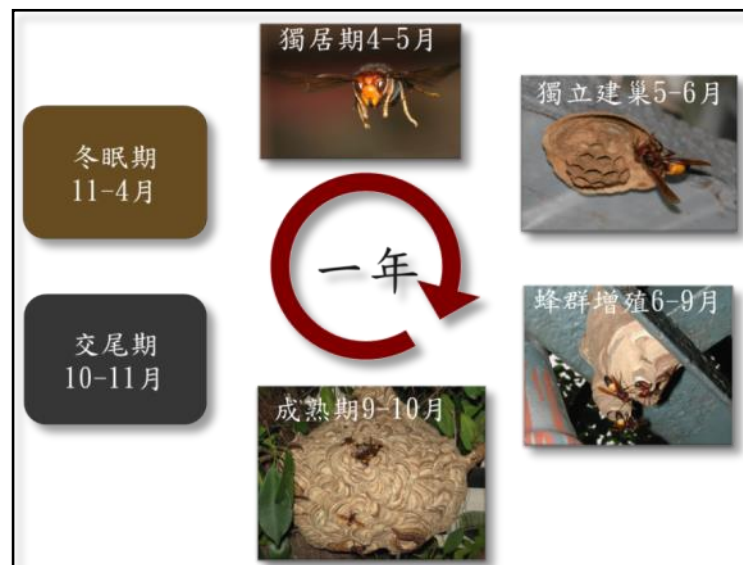
圖 16 虎頭蜂生命週期示意圖

俟近 11 月下旬，天氣逐漸轉冷，幼蟲減少，巢內的老工蜂壽命燃盡，此時如採摘到蜂巢，巢中可能只有少數成蜂