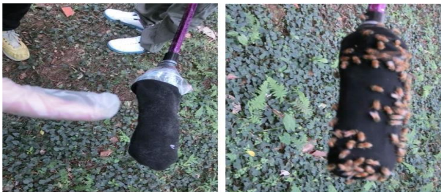
圖 18 左圖：噴灑含 DEET 成分的防蚊液的黑布，可防止蜜蜂靠近螫叮，