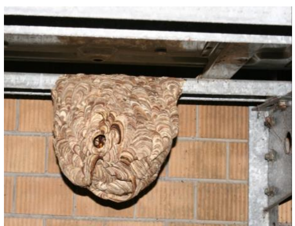
圖 15 虎頭蜂容易築巢之地點，左上：新店森林步道山壁上，左中：北市大安區公寓頂樓屋簷下，左下：北市中山區公寓四樓窗外，右上：台大校園儲水塔鋼架，右中：台大校園建築物窗型冷氣機旁，右下：台北市羅斯福路政府單位分離式冷氣室外機下。