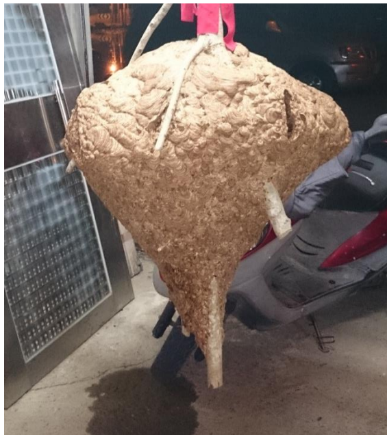
圖 14 黑腹虎頭蜂巨大的蜂巢。請注意其出入口為長條溝狀，通常會有 3~4 處溝狀出入口，俾使其可瞬間發動大量攻擊蜂。

1973 年 10 月曾在南投縣埔里發現一個可能是世界紀錄史上最大的蜂巢，直徑 65 公分，高 95 公分，有 3 個出入口，有蜂巢結構的詳細描述[12]。12 月份(1984 年 12 月採集)蜂的數目 17,764 隻，會在次年 1~2 月間蜂群解體。巢脾數目 10~30 個，巢房數目 40,000 個或更多 [2],[3],[6],[8],[9]。