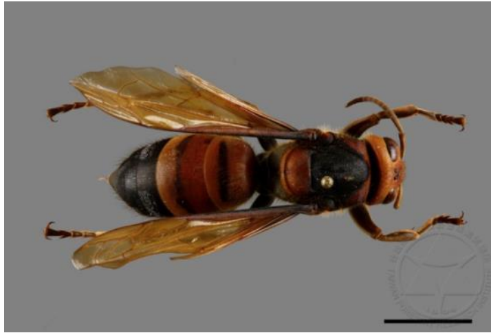
圖 5 姬虎頭蜂成蜂個體

洞中，蜂巢有外殼呈淺灰色，較難尋獲。巢脾數目 2~3 個，巢房數目 300~600 個，蜂之數量約在 100~200 隻間，蜂群在 11 -12 月間解體多[2],[3],[6],[8],[9]。