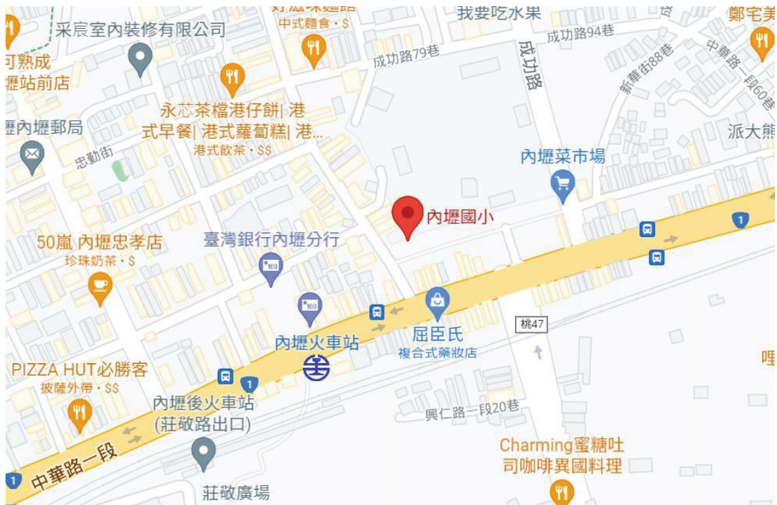
▲ 桃園市內壢國小-地理位置圖