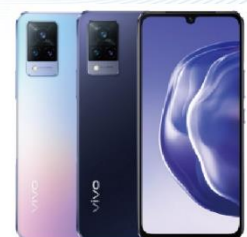
Vivo V21 128G