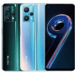
REALME 9 PRO 128G