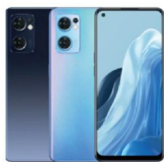
OPPO RENO7 256G