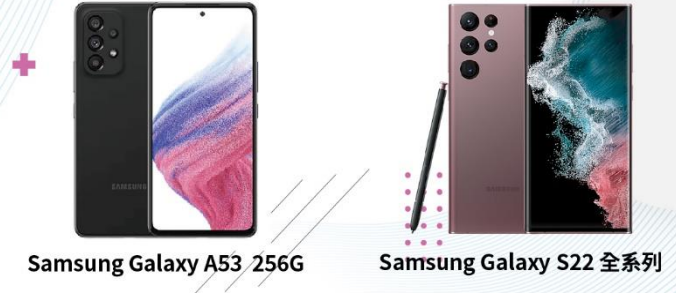
Samsung Galaxy A53 256G