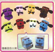
ED-13 大耳狗造型毛巾 內容物: 10色圓珠筆、64K線圈筆記本、膠帶台、木製夾 毛巾尺寸: 30x30cm 售價: 50元/1條