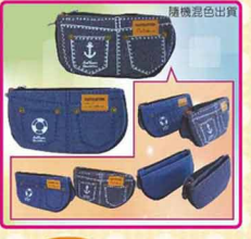
ED-17 牛仔造型萬用包 尺寸: 19x7x10cm 售價: 70元/1個