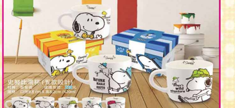
ED-19 史努比湯杯(共五款) 尺寸: 口徑9.8x高8.2x420ml 材質: 新骨瓷 售價: 150元/1個