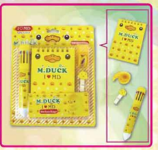
ED-14 mini鴨4件式文具組 內容物: 10色圓珠筆、64K線圈筆記本、膠帶台、木製夾 售價: 50元/1組