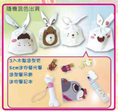
ED-12 超Q迷你文具包 內容物: 3入木製橡皮擦、8cm半吋螢光筆、透明膠袋、透明膠袋、透明膠袋 外觀尺寸: 7x7x1.5cm 售價: 35元/1包