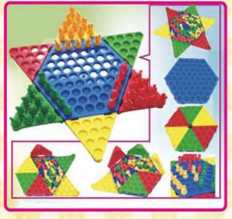
ED-18 收納式新奇專利跳棋 尺寸: 展開34x34x3cm 收納後17.5x31x7.5cm 內容物: 40顆造型棋子(1.5x3.3cm) 售價: 100元/1組