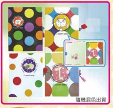
ED-16 帶鎖日記本 尺寸: 16x3x12cm 售價: 70元/1本