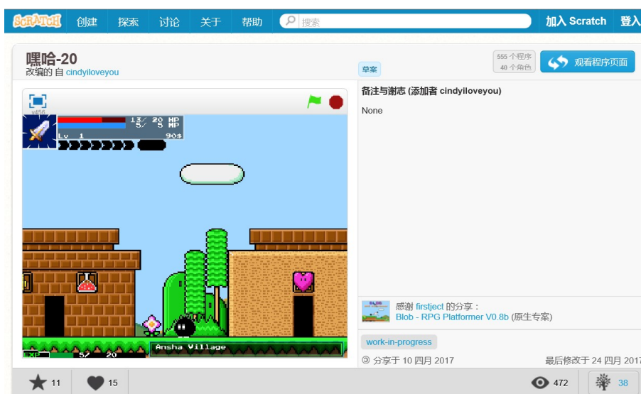
酷酷貓 Scratch 遊戲設計班課程進度表