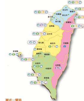
圖式一覽表 ● 失能家庭：兒童服務 ● 失能家庭：成人服務 ● 失能家庭：成人服務 ● 失能家庭：新移民服務 ● 失能家庭：社區服務 ● 失能家庭：專業工程社區服務 ● 弱勢社區：服務學習 ● 關懷服務：愛心轉轉轉