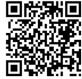
桃園市公立及非營利幼兒園 招生系統